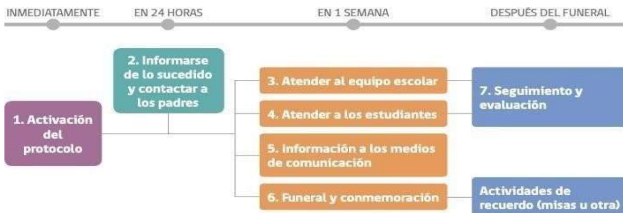
Diagrama de actuación de conformidad a recomendaciones del MINSAL.